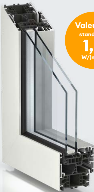
Kömmerling 76 mm WarmCore® avec ouvrant visible